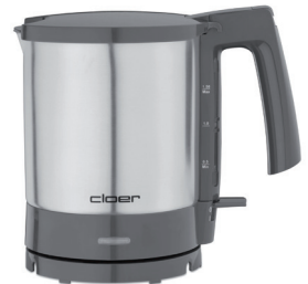
Wasserkocher 4710 / 4711 / 4715 mit Wasserstandsanzeige 1,5 Liter