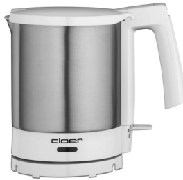
Wasserkocher 4700 / 4701 1,5 Liter