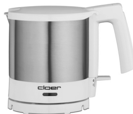
Wasserkocher 4720 / 4721 1,0 Liter